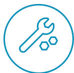
Údržba a servis