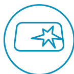
Pojištění čelního skla