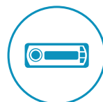
Poplatek za rádio